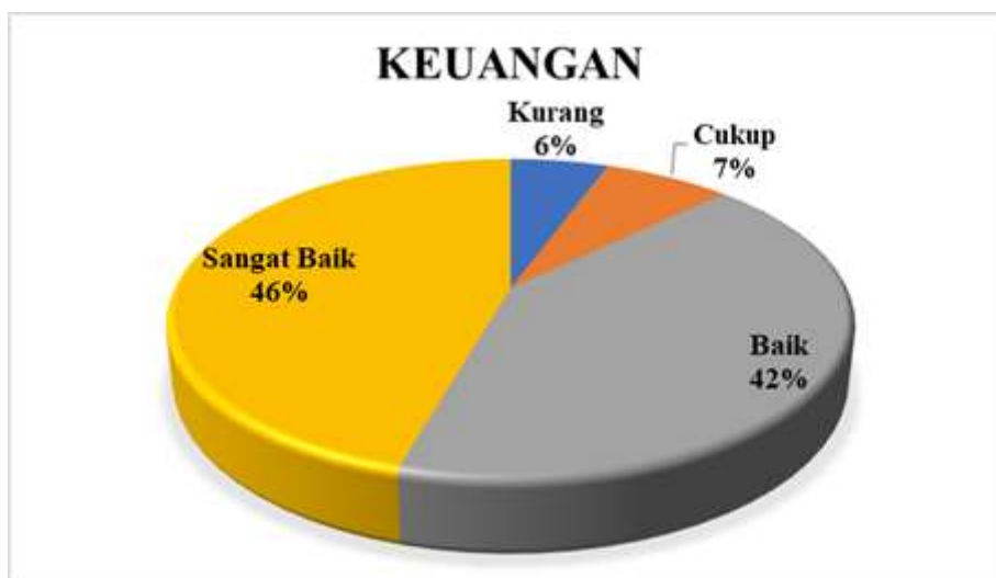
Diagram 3.1 Presentase Hasil Survei Kepuasan Sivitas Akademika terhadap Layanan Pengelolaan Keuangan, Sarana dan Prasarana Manajemen pada Aspek Keuangan

Berdasarkan Diagram 3.1 di atas dapat dilihat bahwa Sivitas Akademika yang memberikan nilai Sangat Baik 46% dan Baik sebanyak 42%. Nilai terbanyak terdapat pada poin 6: Kesempatan untuk mengajar sesuai dengan bidang keahlian. Sivitas Akademika yang memberikan penilaian Cukup hanya 7%, dan Sivitas Akademika yang memberikan nilai kurang sebanyak 6% pada aspek ini. Sehingga pada aspek Keuangan berada pada kategori Sangat Baik .