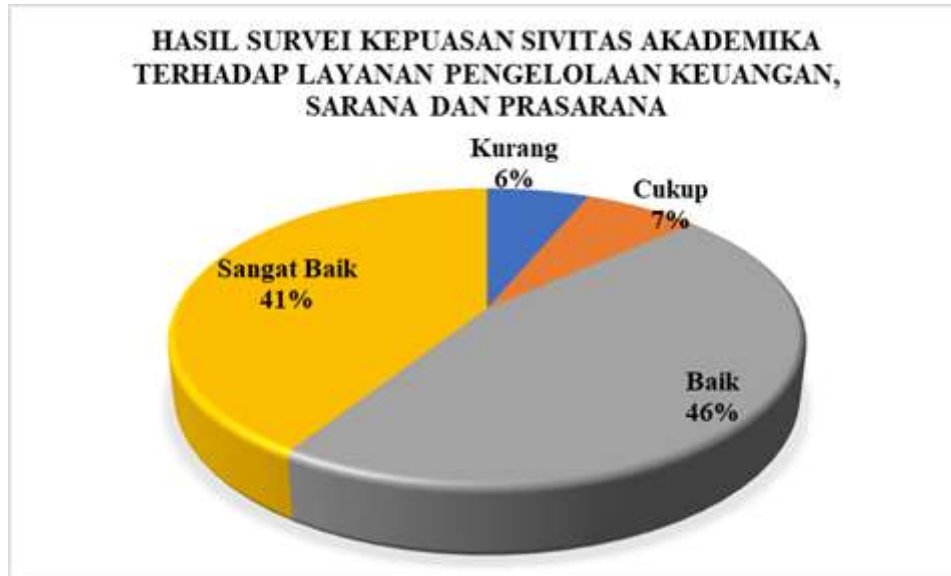
Diagram 4.1 Persentase Hasil Survei Kepuasan Sivitas Akademika Terhadap Layanan Pengelolaan Keuangan, Sarana dan Prasarana Prodi Manajemen

Berdasarkan hasil survei dapat dilihat pada Diagram 4.1 yang menggambarkan bahwa secara keseluruhan Sivitas Akademika program studi Manajemen memberikan nilai Sangat Baik sejumlah 41%, nilai Baik sejumlah 46%, nilai Cukup sejumlah 7%, nilai kurang 6%. Jika merujuk pada Tabel 2.3 nilai persentase tersebut berada pada rentang 41-60%, sehingga dapat disimpulkan bahwa kepuasan Sivitas Akademika Terhadap Layanan Pengelolaan Keuangan, Sarana dan Prasarana di program studi Manajemen masuk pada kategori CUKUP BAIK .